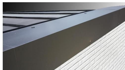
「片流れ i-ROOF II 150」による壁側の施工