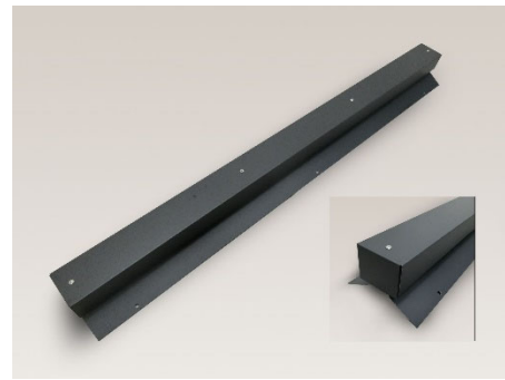
アンダー換気部材