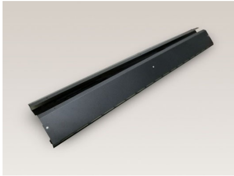
アッパー換気部材